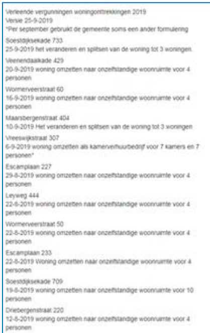
Figuur 2 Voorbeeld van een lijst, zoals Wijkberaad Leyenburg maandelijks publiceert

Met de in juni 2019 vastgestelde huisvestingsverordening is het splitsen van een woning in meerdere woningen in bijna de gehele stad onmogelijk geworden en in de paar wijken - Huygenspark, Wateringse Veld en delen van Ypenburg en Leidschenveen - waar dit nog wel mogelijk is, zijn de eisen streng. Maar voor het tegengaan van kamerbewoning was er - behalve een mogelijke weigering in 6 kwetsbare